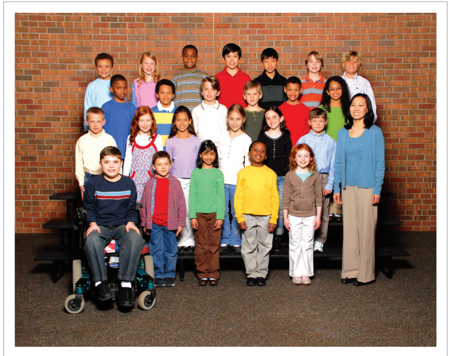
Design and class posing may vary by school. La pose de la clase y el diseño pueden variar según la escuela.

Questions? Please contact Customer Service at 800-244-4373.