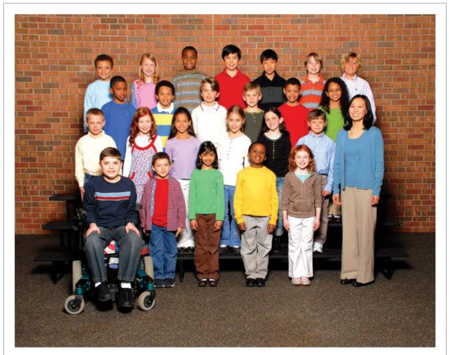
Design and class posing may vary by school. La pose de la clase y el diseño pueden variar según la escuela.

Questions? Please contact Customer Service at 800-244-4373.